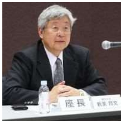
迷惑メール対策推進協議会 第9回会合（総会）の様様

電子メールの利用環境の一層の改善に向け、関係者間の緊密な連絡を確保し、最新の情報共有、対応方策の検討、対外的な情報提供などを行うことにより、産学官（※別添 1）など迷惑メール対策に関わる関係者が幅広く集まり、関係者による効果的な迷惑メール対策の推進に資することを目的として、2008年11月27日に設立。第1回会合で、迷惑メールの追放に向けた決意と具体的に講ずべき措置等をまとめた「迷惑メール追放宣言」（※別添 2）を採択しています。