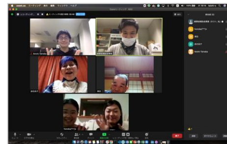
「R2デジタルデバイド解消研究開発」時のスマホ講習会等の状況

※コロナ禍の折、感染症対策を施したマンツーマンレッスン+Zoom活用レッスン等を20回以上実施