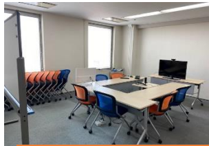
地域DXデータ分析サロン