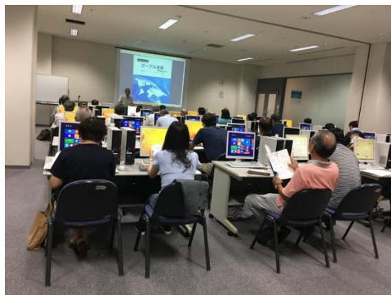
会場となる太田市役所セミナールーム