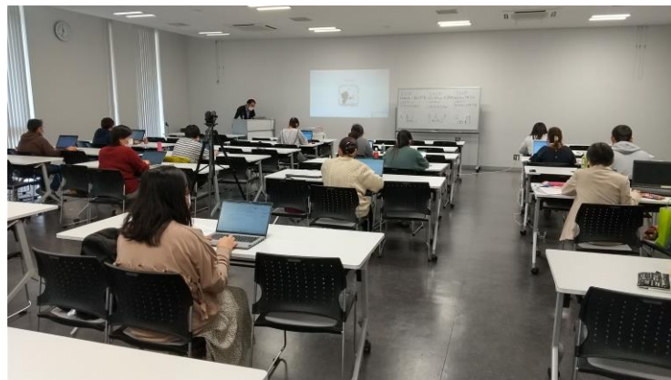
講師育成の実施イメージ