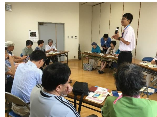
松山市桑原公民館